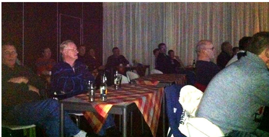
aandachtig werd er geluisterd