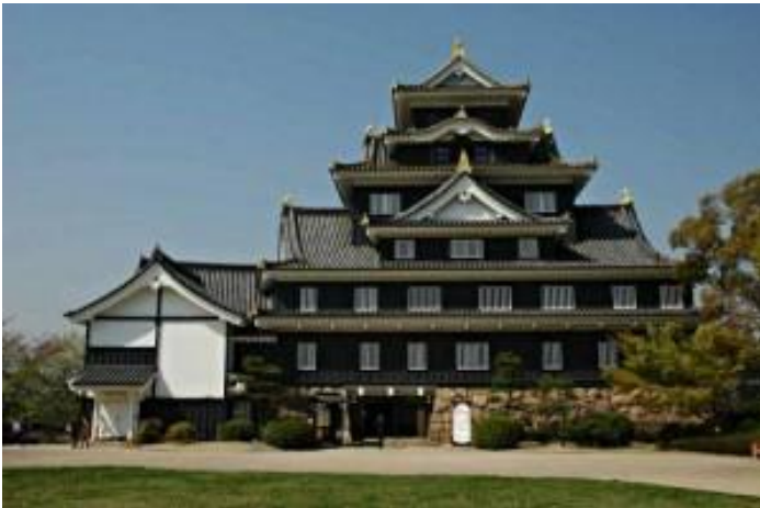
Henze toonde ons de mooiste kastelen en tempels