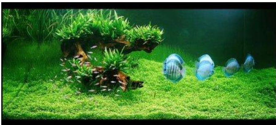
Japanse aquaria zijn ook fabuleus