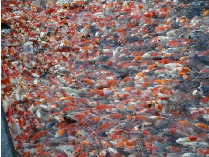
Zo zag Henze er veel, wat een kleurenpracht