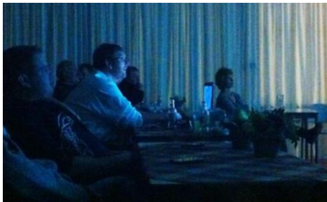
De Aquarianen laten het licht van Nishikigoi op zich schijnen