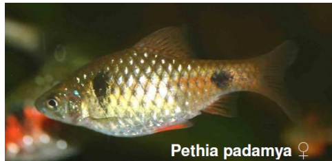
Pethia padamya ♀

Dit visje is al langere tijd zeer bekend en eigenlijk altijd wel verkrijgbaar. Lange tijd heeft men gedacht dat het een kweekvorm was, afkomstig uit Rusland, maar het bleek toch om een afzonderlijke soort te gaan. De visjes komen voor in Myanmar en dat kan er ook de oorzaak van zijn, dat men lange tijd niet precies heeft geweten waar ze vandaan kwamen. Mooi zijn ze wel, vooral de mannen. Maar ook de dames zijn niet lelijk. Uit het verspreidingsgebied van deze barbeeltjes komen veel bekende aquariumvissen waarmee ze alle drie prima te combineren zijn. Te denken valt aan diverse soorten danio's, bijvoorbeeld Danio choprae , D. kyathit , of D. albolineatus , maar ook aan verwante barbeeltjes,