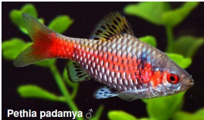
Pethia padamya ♂

Maar bij Pethia stoliczkana hebben vooral de mannen een rood-zwarte tekening in de vinnen. En ze kunnen over het lijf ook roder worden. Dit barbeeltje wordt tegenwoordig als een afzonderlijke soort beschouwd. Ze komen voor meer oostelijk gelegen gebieden dan Pethia ticto : het noordoostelijke deel van India, in Myanmar tot in Thailand en westelijk Laos. Het plaatje laat een exemplaar uit Myanmar zien. En in dat land komt het visje samen voor met de derde barbelensoort die lange tijd als “ Barbus ticto ” bestempeld is: de Odessa-barbeel, die heden ten dage door het leven gaat onder de naam Pethia padamya .