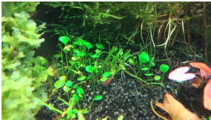
Marsilea hirsuta (midden) in het aquarium van Detse Witveen, de onderwatervorm heeft hier maar 1 blaadje.

De laatste soort die er in de hobby rondgaat is een M. spec "Ghana", die door WAP-lid Peter Kettenis is meegenomen uit Ghana. Ook deze soort lijkt sprekend op de soorten die als M. spec en als Marsilea crenata worden aangeboden. Deze soort schijnt onderwater niet te houden te zijn en is niet in de handel te verkrijgen.