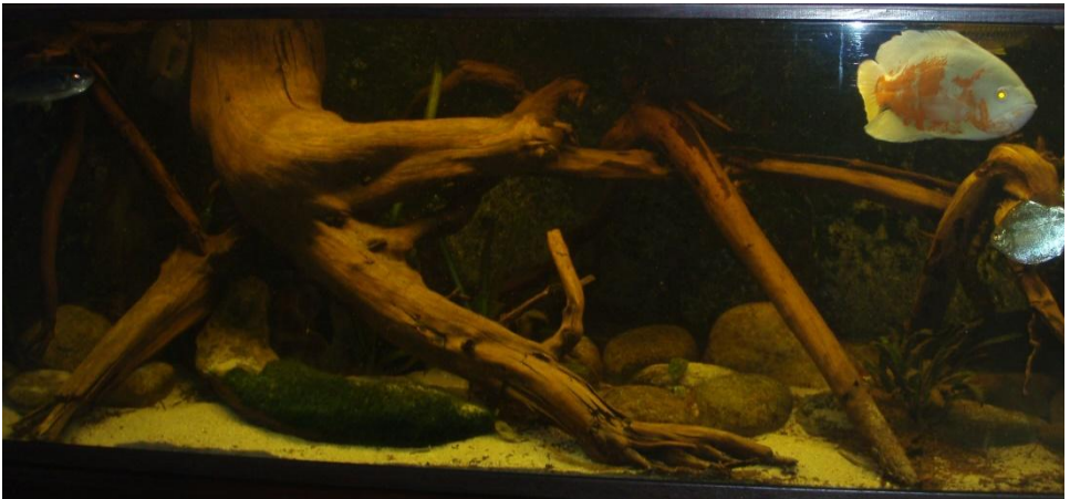
Aquarium Bart in 2010

Op de vorige vrije avond hebben we foto's en filmbeelden gezien van een aantal leden, het zou leuk zijn als de leden die toen niet aan de beurt zijn geweest, nu de foto's van hun aquarium laten zien. Dus graag foto's of filmpjes meenemen op je telefoon of USB-stick.