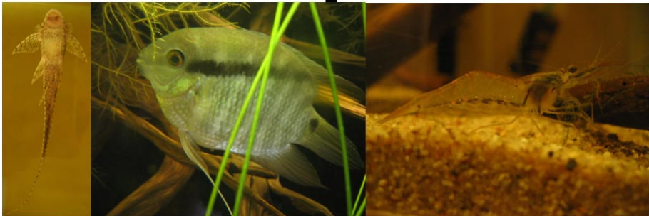
Sturisomatichthys , leightoni

Nog een paar foto's van gevangen soorten hieronder om u een idee te geven.